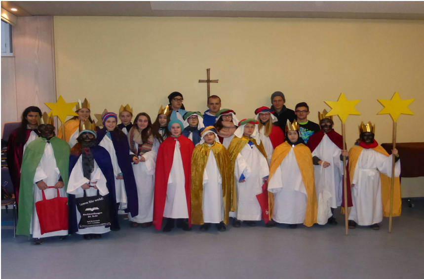
Starnsingergruppe der Ministranten 2015

Herzlich Gedankt sie an dieser Stelle allen Beteiligten, besonders den Leitern der Ministranten und Pfadfinder und nicht zu letzt allen Spenderinnen und Spendern.